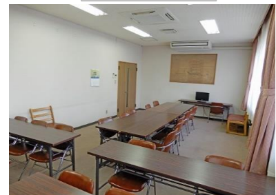
共有食堂・談話室